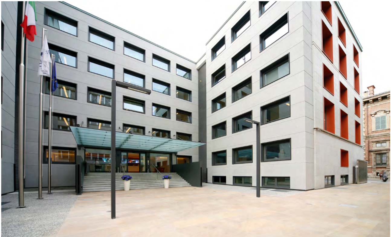
Sede Gruppo DeA Capital.